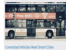
Connected Vehicles Meet Smart Cities